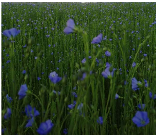
Lin en fleurs

Les lins semés en avril sont au stade 60 cm à boutons floraux. Les plus avancés commencent à fleurir nettement.