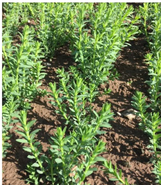
CA 80 Lin au stade B5 DAMARA – semis du 30 mars - ABBEVILLE