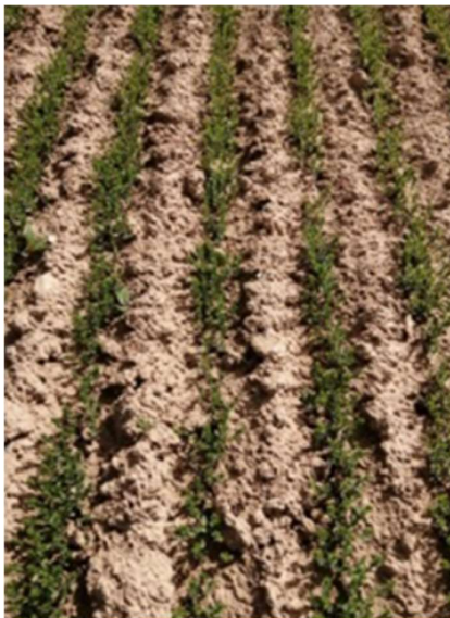
Plate forme d’essai Arvalis – teillage Lamerant

La majorité des parcelles a dépassé le stade de sensibilité aux altises ; Il ne reste à surveiller que les derniers semis. Ceux-ci, à la faveur des pluies, devraient sortir rapidement du stade de sensibilité