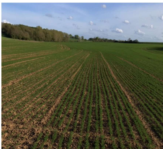
CA 80 Lin au stade D1 DAMARA – semis du 20 mars - ABBEVILLE

Quelques observateurs font état de parcelles « très poussantes ».