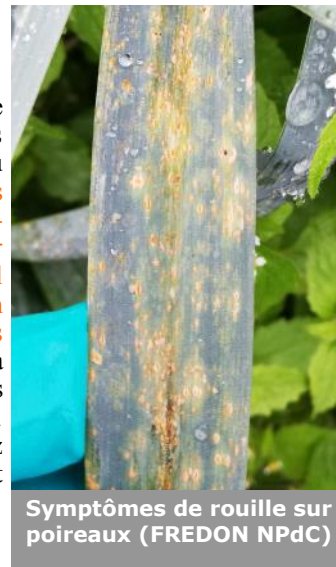
Symptômes de rouille sur poireaux (FREDON NPdC)

Les symptômes de rouille sont caractéristiques: il s'agit de pustules orangées de 1 ou 2 mm de diamètre, plus ou moins foncées, elles sont situées sur les faces inférieures ou supérieures des feuilles. Des pustules ont ainsi été observées sur les parcelles de poireaux d'Allouagne (62) et d'Herlin-le-Sec (62). Si cette pression reste faible (20% des pieds et sur de très faible surface foliaire) sur le site d'Allouagne (62) il n'en est pas de même sur la parcelle d'Herlin-le-Sec (62). En effet sur ce site 100% des plantes présentent des symptômes de rouille et en moyenne 30% du feuillage est atteint. La transmission se fait d'une saison sur l'autre par les cultures de poireaux encore en place, les alliacées sauvages, l'ail... Le vent transporte les spores sur des distances parfois assez importantes. La meilleure méthode pour éviter la maladie est de choisir des variétés tolérantes à la rouille.