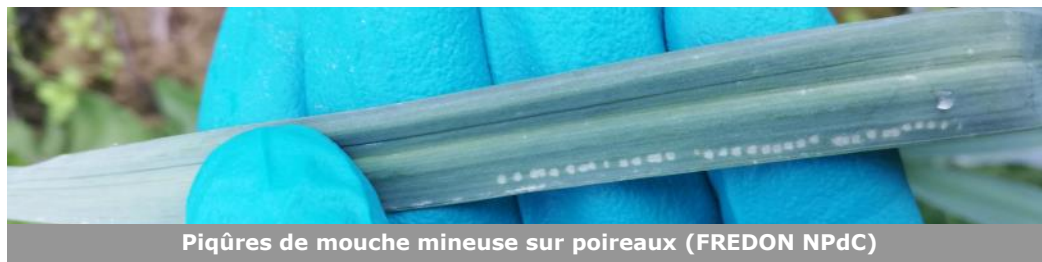
Piqûres de mouche mineuse sur poireaux

A Bois-Grenier (59), des piqûres de mouches mineuses sont observées sur 12% des poireaux. Des piqûres ont aussi été observées sur des plants d'oignon à Loos-en-Gohelle (62). Les piqûres sont alignées régulièrement sur l'axe vertical de la feuille de poireau. Un vol semble toujours en cours, si possible, il est urgent de mettre en place les filets anti-insectes.