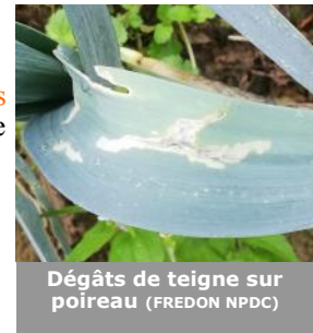
Dégâts de teigne sur poireau

Pour rappel, le seuil de nuisibilité est atteint dès la présence de chenilles.