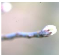
Stades phénologiques C (à gauche) et C 3 sur pommier

Les conditions climatiques annoncées par Météo France pour les jours à venir ne sont pas favorables à l'entrée en parcelle. Des conditions très perturbées sont prévues sur la région avec la présence d'un vent fort pour les jours à venir avec une légère baisse des températures.