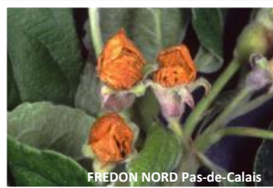
Dégât d'anthonome du pommier sur boutons floraux

Les larves poursuivront alors leur développement au sein des boutons aux dépens des organes de la fleur.