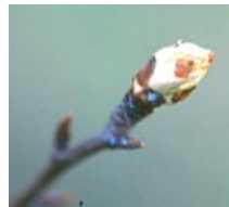
Stades phénologiques C 3 (à gauche) et D sur poirier