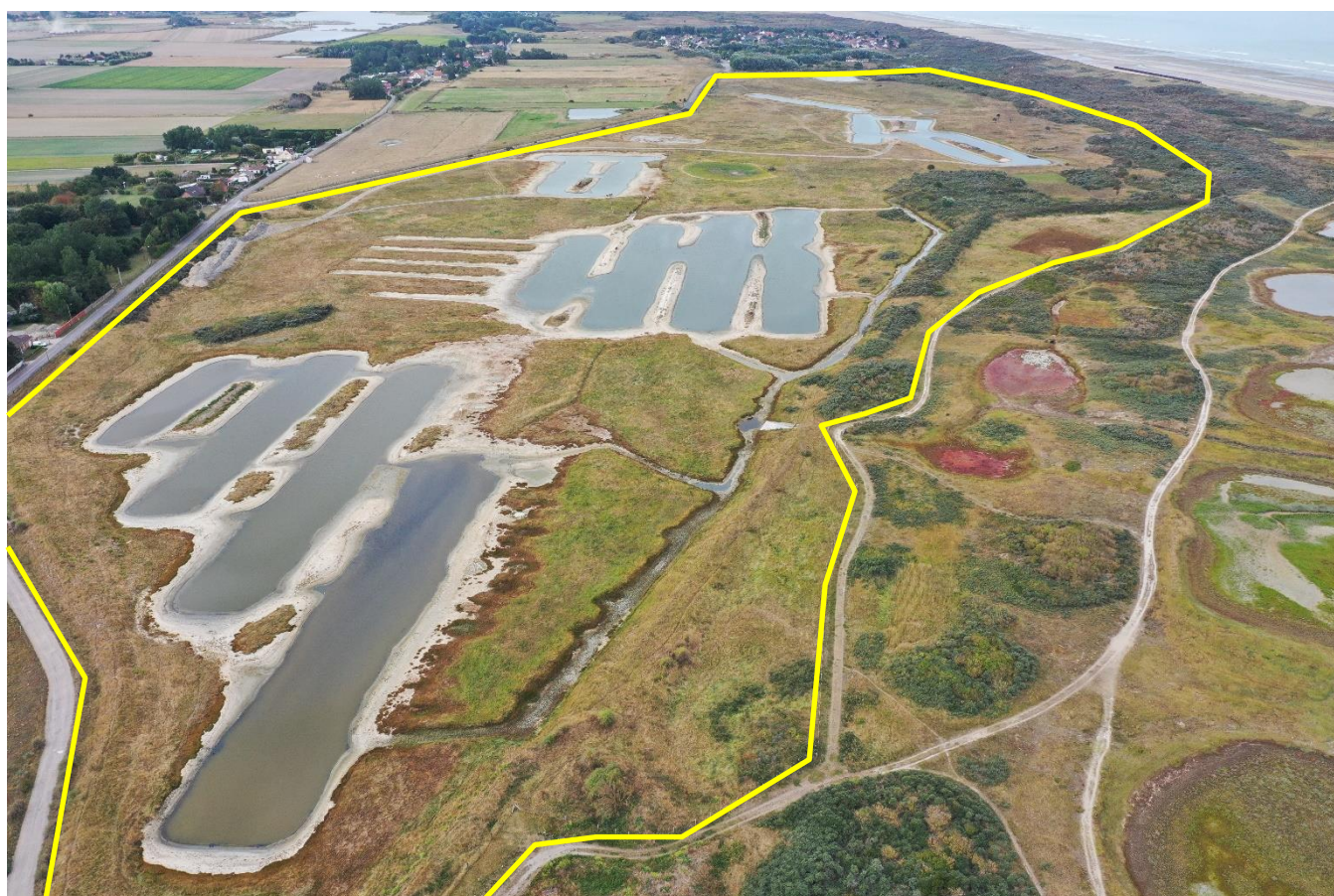
Vue aérienne de la zone faisant l'objet de l'appel à manifestation d'intérêt (septembre 2019)